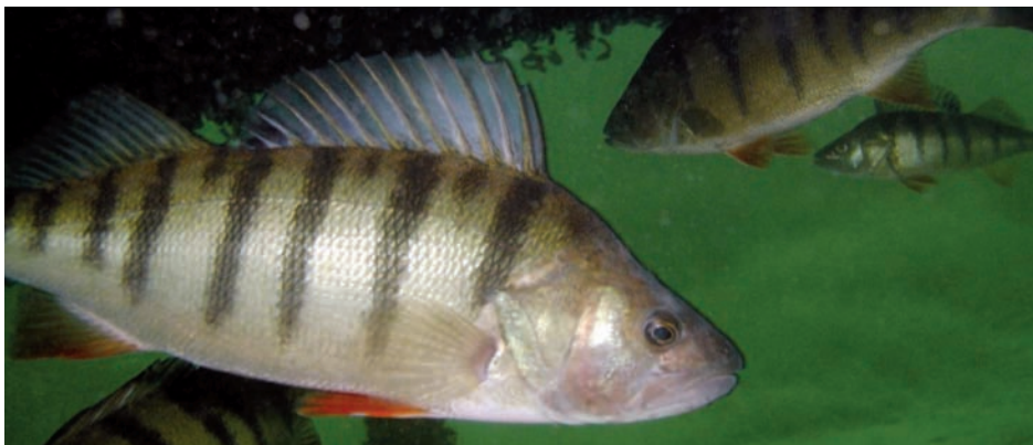
Der Flussbarsch, besser bekannt als Egli, ist ein beliebter Speisefisch.

Die meisten Arten der Familie leben zwar in nordamerikanischen Gewässern. Der Barsch ist für uns aber der europäische Flussbarsch ( Perca fluviatilis ), der über ganz Europa verbreitet ist. Seine beiden Rückenflossen sind getrennt. Der Kiemendeckel ist am Hinterrand mit einem Stachel versehen. Der gelbliche bis dunkelgrüne Fisch ist schwach bis kräftig senkrecht gebändert. Bauchflossen und Afterflosse sind messinggelb bis blutrot, die Schwanzflosse meist rötlich. Barsche finden sich in allen möglichen Gewässertypen, am meisten